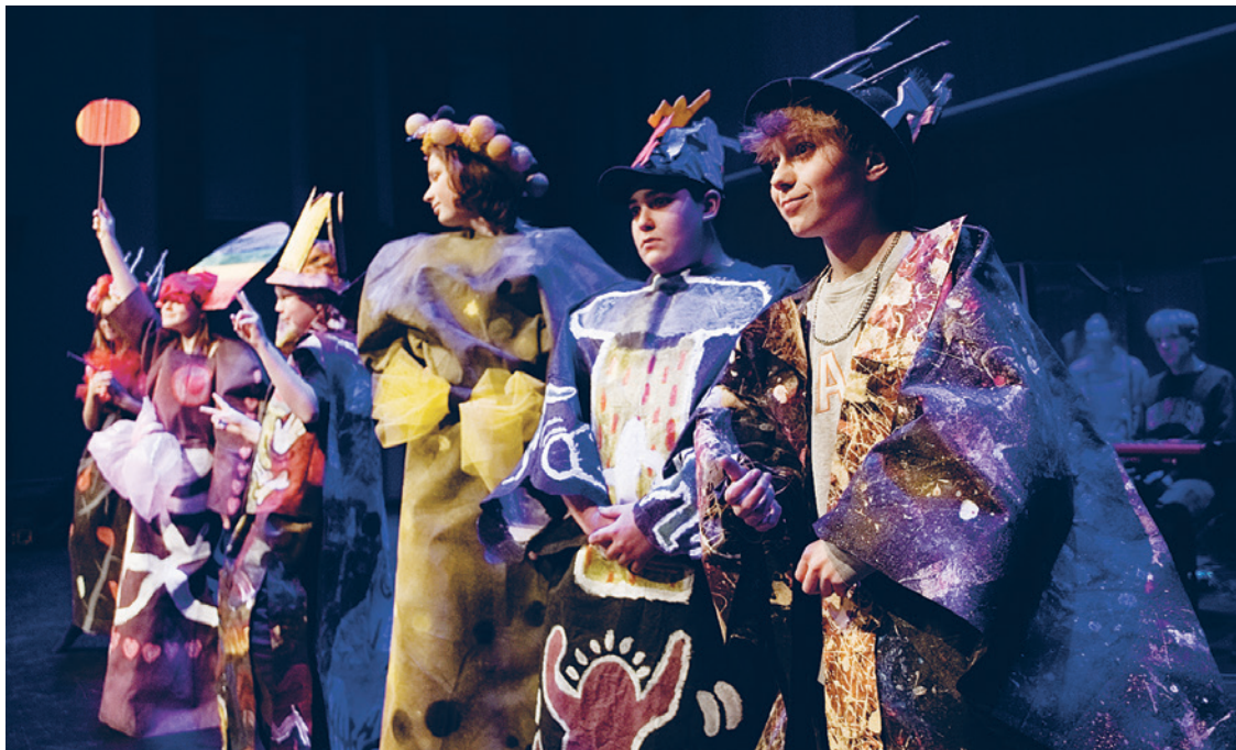
Bildkonst vid Wava-institutet. Kuvataide Wava-instituutissa.

Wava-institutet informerar kontinuerligt om jubileumsårets evenemang på sin hemsida och via sina kanaler på so-