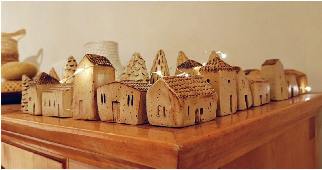
Dessa små hus är tillverkade i stengods och glaserade med blålera från larmsjön.