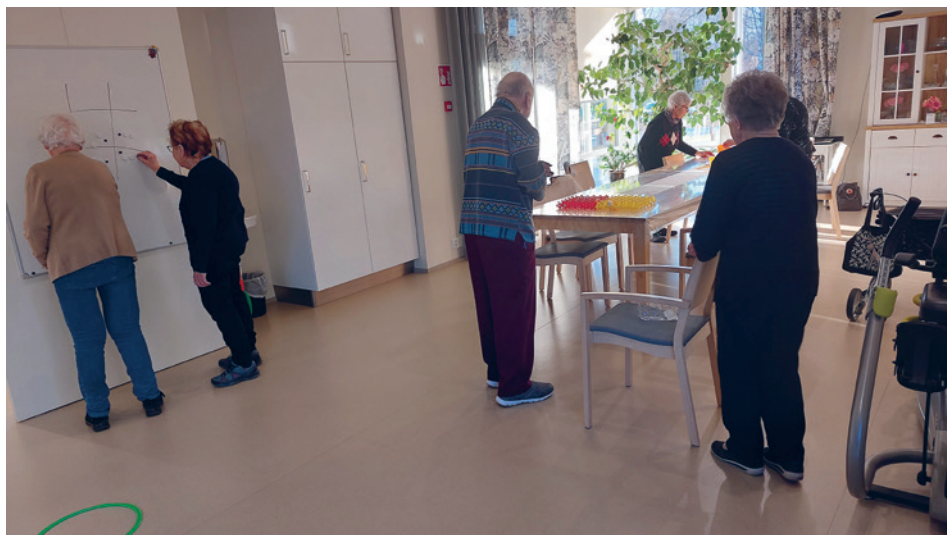
Projekt stärka de äldres hälsa samlas i Daglunden