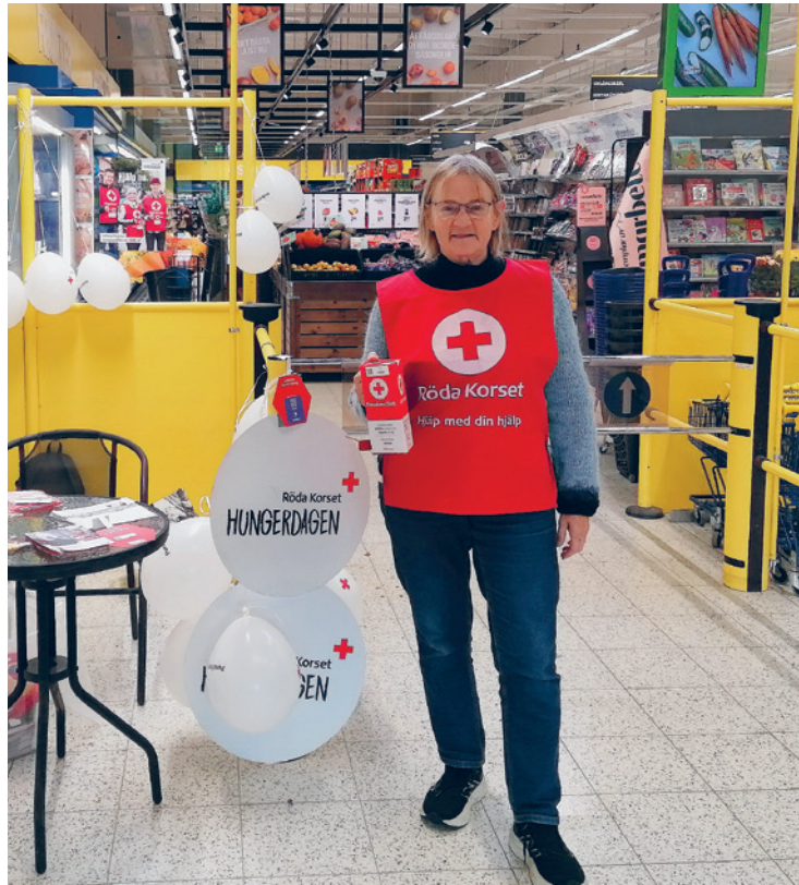
Hungerdagsinsamlingen inbringade 5 288 €.

Om du hellre blir stödmedlem, och betalar en årlig avgift på 20 € (10 € för ungdomar under 29 år), stöder du såväl det nationella Finlands Röda Kors