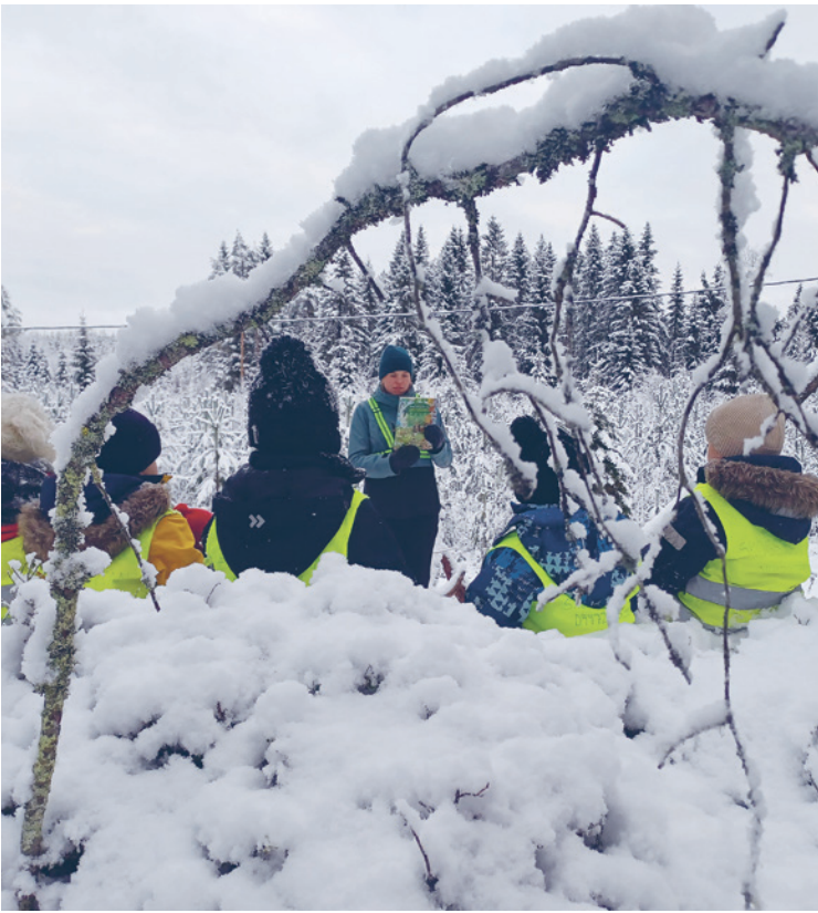
Några daghem firade med skogsutfärder.