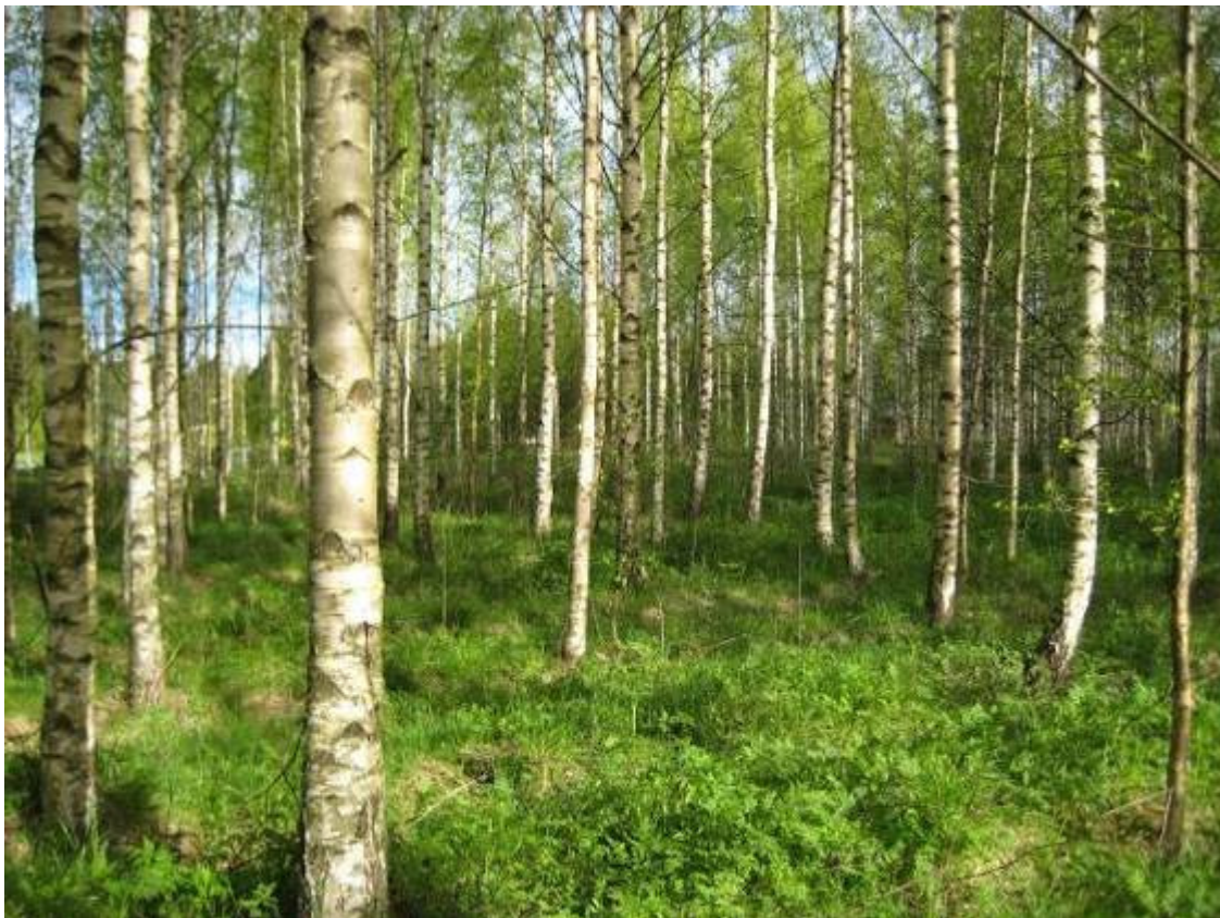
Bild 6. I figur 19 finns en gles ca 40-årig björkskog planterad på gammal åkermark.

Figur 19. Ca 40-årig björkskog med så gott som enbart björk ( Betula sp. ) i trädskiktet. Skogen rätt nyligen gallrad och röjd och buskskikt saknas. I fältskiktet påträffas ekorrbar ( Maianthemum bifolium ), gräsväxtlighet, smörblomma ( Ranunculus acris ), åkerfräken ( Equisetum arvense ), borsttistel ( Cirsium helenioides ) och brännässla ( Urtica dioica ).