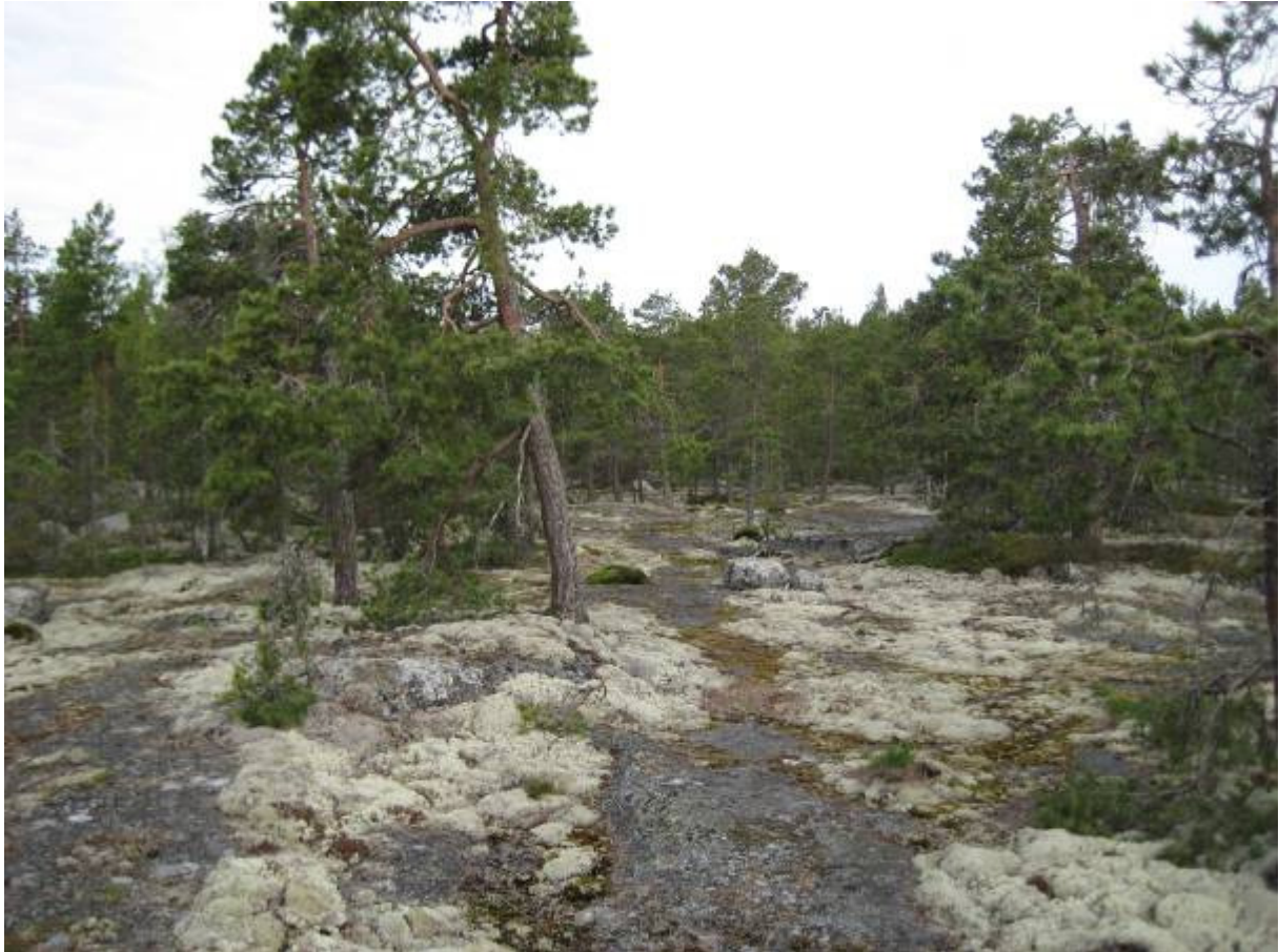
Bild 3. På Risöbergen (figur 3) växer en hällmarkstallskog i naturtillstånd. Figuren utgör en särskilt viktig livsmiljö enligt skogslagen.

Figur 3. Risöbergen är ett bergsområde med en hällmarkstallskog i så gott som naturtillstånd. Trädskiktet är totalt talldominerat ( Pinus sylvestris ). I fältskiktet påträffas ljung ( Calluna vulgaris ), grå renlav ( Cladina rangiferina ), gulvit renlav ( Cladina arbuscula ), fönsterlav ( Cladina stellaris ), lingon ( Vaccinium vitis-idaea ) och odon ( Vaccinium uliginosum ). Skogstypen är den kargaste ståndorten av alla eller lavmo (CIT) där tillväxten per år är minimal. Risöbergen utgör en särskilt viktig livsmiljö enligt skogslagen och bör bevaras.