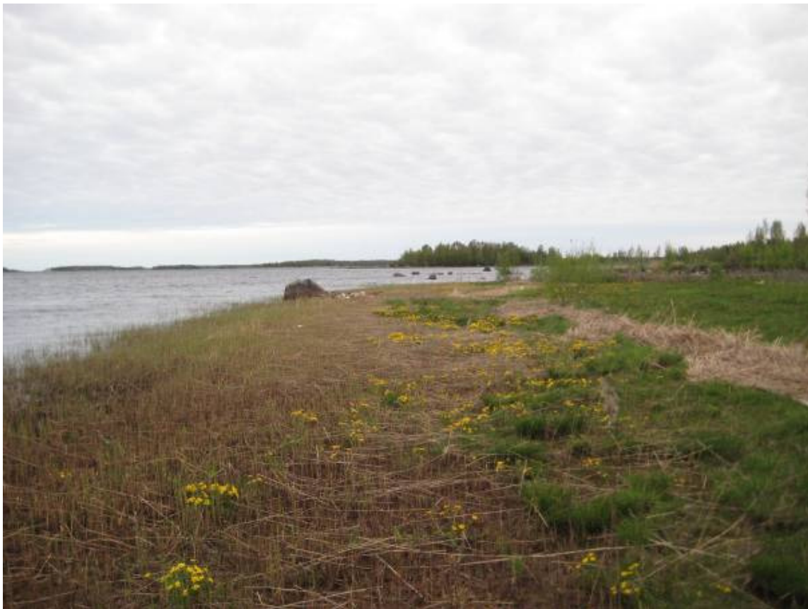
Bild 2. Ställvis finns vid stranden i figur 1 korta avsnitt som är nära naturtillstånd. Här växer bl.a. kabbeleka och bladvass.

Figur 2. Flerårig och mångskiktad tallskog ( Pinus sylvestris ). Trädskiktets ålder varierar mellan 60 till 80 år. Figuren är delvis en hållmarkstallskog. I trädskiktet förekommer ställvis ett inslag av björk ( Betula sp. ) och gran ( Picea abies ), speciellt som ett underskikt. Speciellt längre österut förekommer mera gran ( Picea abies ) och björk ( Betula sp. ) i trädskiktet. I buskskiktet förekommer en del enris ( Juniperus communis ) och rönn ( Sorbus aucuparia ). I fältskiktet påträffas lingon ( Vaccinium vitis-idaea ), kråkbär ( Empetrum nigrum ), odon ( Vaccinium uliginosum ) och blåbär ( Vaccinium myrtillus ). Mycket rikligt med skägglav växer på de tvinvuxna granarna. I figurens södra del förekommer på ett litet område även en ca 30-årig, gallrad och gles tallskog. I trädskiktet förekommer här nästan enbart tall ( Pinus sylvestris ). Ställvis förekommer ett litet inslag av björk ( Betula sp. ) och enstaka granar ( Picea abies ). I buskskiktet finns däremot ställvis rätt rikligt med björk ( Betula sp. ) och lite rönn ( Sorbus aucuparia ). I fältskiktet påträffas lingon ( Vaccinium vitis-idaea ), blåbär ( Vaccinium myrtillus ) och ekorrbar ( Maianthemum bifolium ). Skogstypen är här frisk moskog (MT).