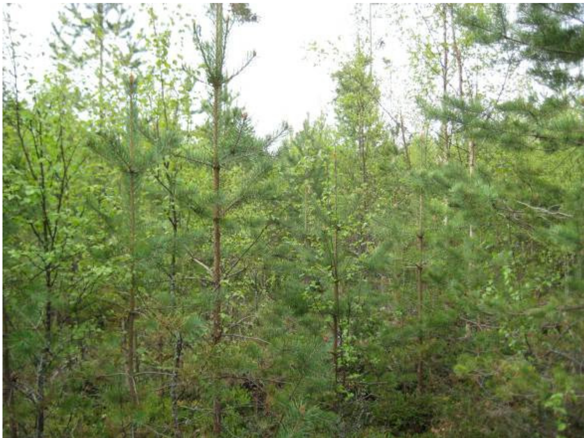
Bild 4. Figur 9 utgörs av en ung och mycket tät tallplantskog i fröträdsställning med rikligt inslag av björk.

Figur 9. Ca 12-årig, ogallrad och mycket tät tallplantskog ( Pinus sylvestris ) med överståndare av frötallar. Rikligt inslag av björk ( Betula sp. ) och gran ( Picea abies ) i plantskogen. I fältskiktet påträffas lingon ( Vaccinium vitis-idaea ), blåbär ( Vaccinium myrtillus ), ekorrhör ( Maianthemum bifolium ), skogsstjärna ( Trientalis europaea ) och vårfryle ( Luzula pilosa ). I söder finns ett mycket större inslag av gran ( Picea abies ) och björk ( Betula sp. ) i plantskogen och dåligt med tallplantor. Skogstypen är frisk moskog (MT).