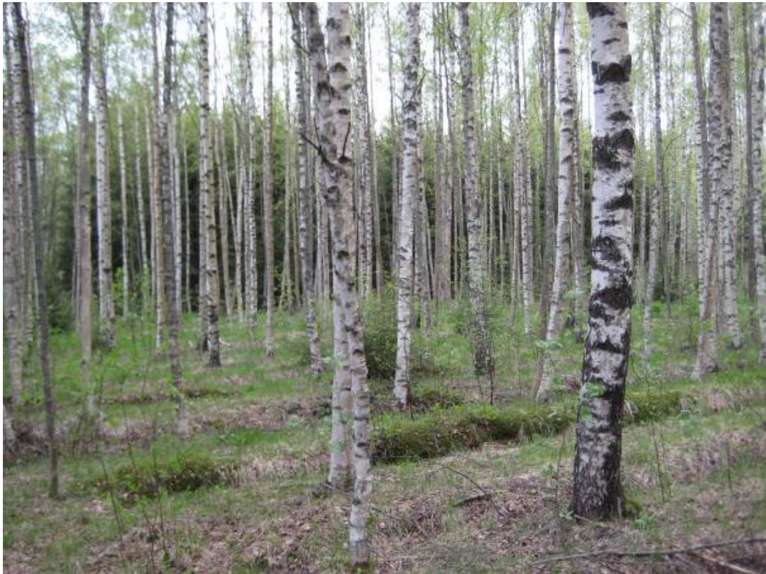
Bild 5. I figur 13 växer en ca 45-årig björkskog samt i väster en tät, ca 45-årig granskog (syns i bakgrunden).

Figur 14. Består i öster av en hällmarkstallskog som dock icke är i naturtillstånd. I trädskiktet påträffas ca 50-60 åriga tallar ( Pinus sylvestris ), men dessutom ett mycket stort inslag av lövträd. Lövträden, bl.a. rönn ( Sorbus aucuparia ) och vide ( Salix sp. ) samt gran ( Picea abies ) förekommer dock framförallt som ett underskikt. I buskskiktet förekommer enris ( Juniperus communis ) och röda vinbär ( Ribes spicatum ). Fältskiktet är starkt kulturpåverkat med älggräs ( Filipendula ulmaria ), hundfloka ( Anthriscus sylvestris ), harsyra ( Oxalis acetosella ), ekorrbar ( Maianthemum bifolium ), ängssyra ( Rumex acetosella ), vänderot ( Valeriana sambucifolia ), brännässla ( Urtica dioica ) och duntrave ( Epilobium angustifolium ). I fältskiktet påträffades även lite kattfot ( Antennaria dioica ). Västerut mot havet finns flera privata båthamnar där man anlagt båtplatser med gräsmattor.